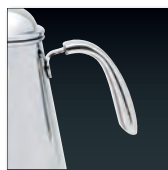
湯量を一定に保って 注ぎやすい形状