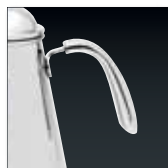
湯量を一定に保って 注ぎやすい形状